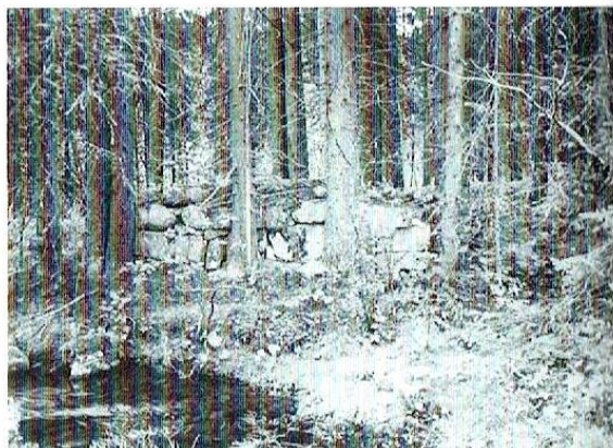
Det er i dag tett skog der Svartåsmordet ble begått. Det ene brukaret er intakt, og muren i elva til hjelp for tømmerfløtingen er meget godt bevart.