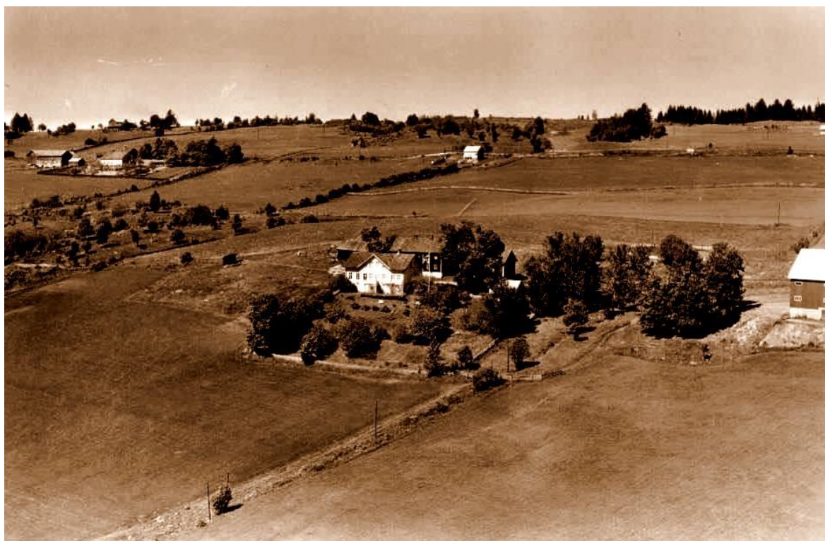
Prestegarden i Vardal. Den hvite bygningen midt på bildet var presteboligen, bygget i 1863, hvor Aadnæs-maleriene ble funnet. Maleriene hadde stått i den mørke bygningen (forpakterboligen) som ligger bak. Denne var prestebolig fram til den ble flyttet i 1863. Forpakterboligen ble gitt til Eiktunet i 1959, men flytting ble aldri gjennomført. Presteboligen brant i 2011.