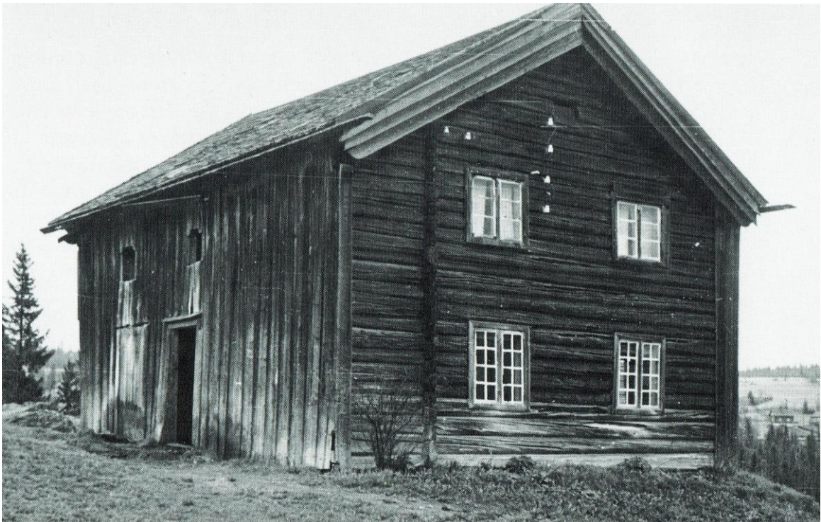
Engumstua før flytting til Eiktunet