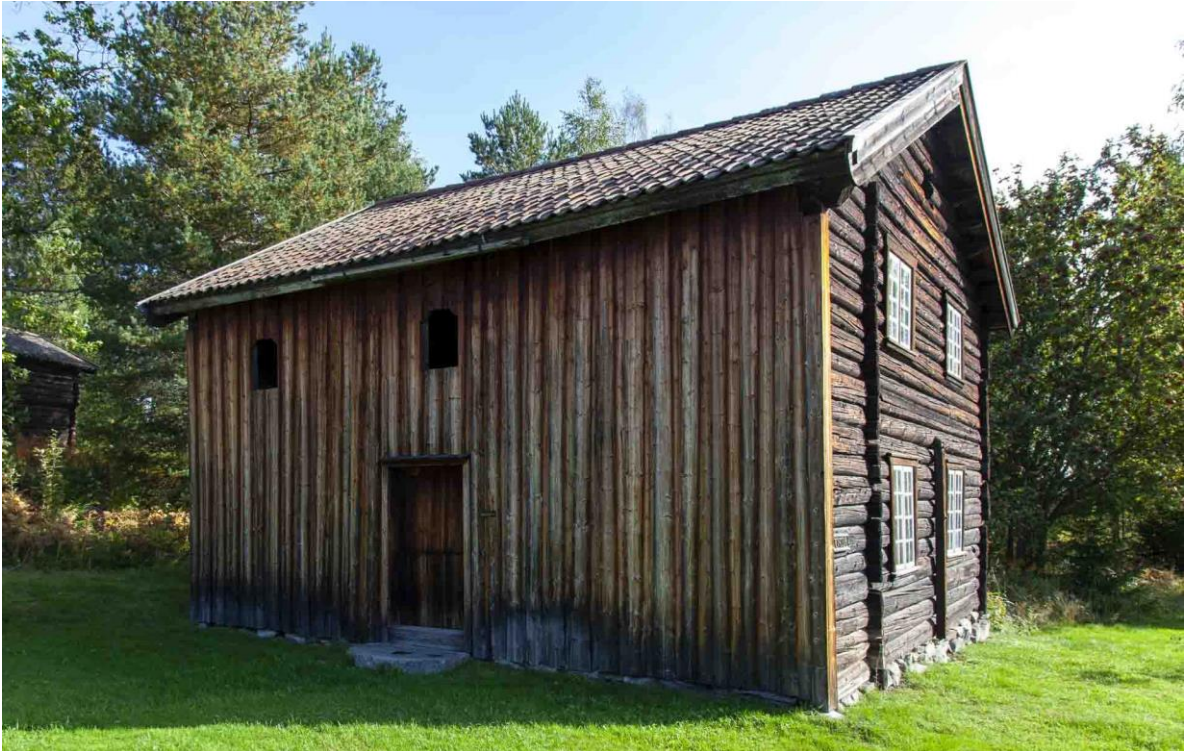
Engumbygningen ble satt opp på Eiktunet i 1955.