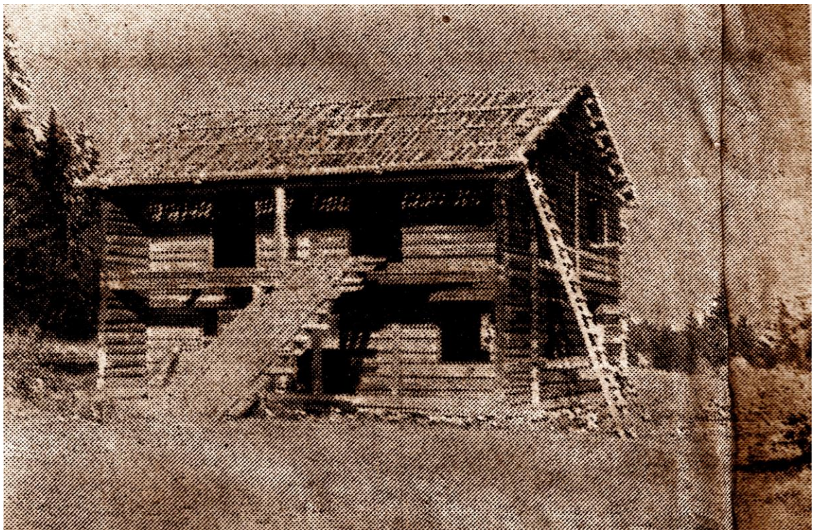
Engumstua under oppsetting i 1955. Huset var ett av de fire første som kom til Eiktunet.

Omtale av Engumstua i jubileumsskrift for Eiktunet 1964.