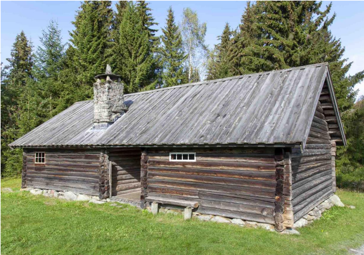
Brennakksetra kom til Eiktunet i 1963.