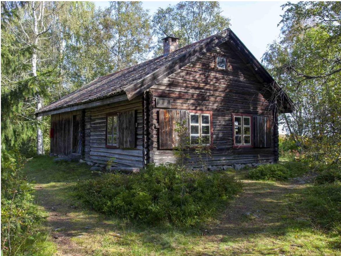
Blikkenslagerverkstedet fra Ringstad.

På husmannsbruket Ringstad under Østre Skjerven i Vardal ble det utviklet håndverksferdigheter innen kardeproduksjon og blikkenslagervirksomhet. Det var familiene Haugom og Ringstad som sto bak dette. Familiene hadde et felles utspring fra Vestre Skjerven.