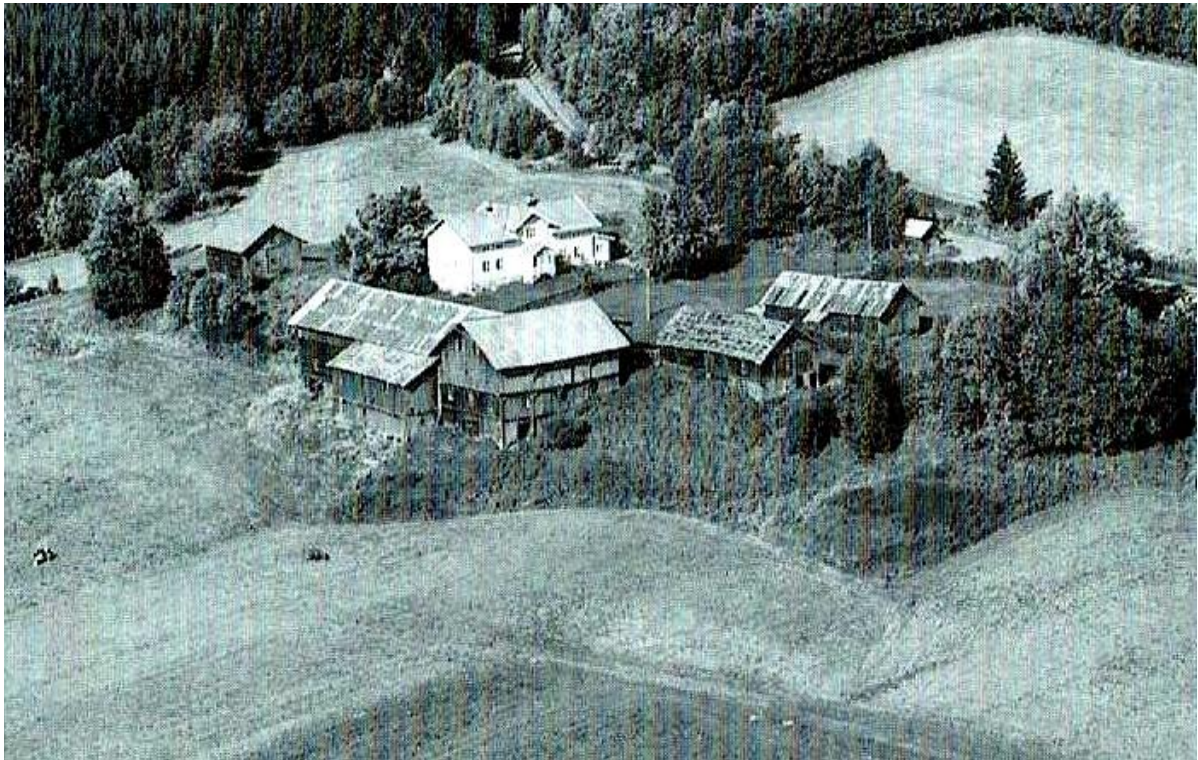
Seval etter at bygningen var flyttet.