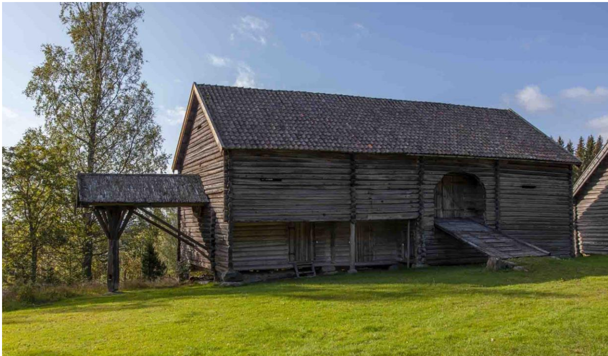
Låven fra Søndre Breiskallen.

Låven sto på Søndre Breiskallen, ved fossen, på sørsiden av Hunnselva. Garden, og dermed låven, lå i Vestre Toten kommune. Garden hadde ikke store arealer men derimot den verdifulle retten til å utnytte fallet i elva. Vardal Tresliperi ble etablert i 1869, og en forutsetning for driften var tilgjengelig kraft til produksjonen. Søndre Breiskallen ble da kjøpt opp og gardsdriften ble med tiden lagt ned. Etter hvert forsvant alle husene på garden, og som det siste ble låven revet i 1955. Den ble gitt til Eiktunet og satt opp igjen samme år. Hestevandringen til venstre på bildet kommer fra Seegard i Snertingdal og ble montert i 1979.