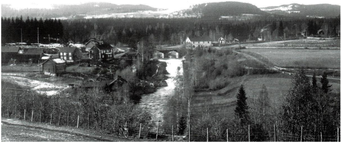
Søndre Breiskallen helt til venstre på bildet