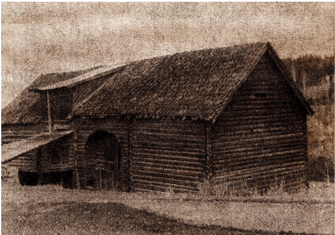
Breiskallåven før nedrivning