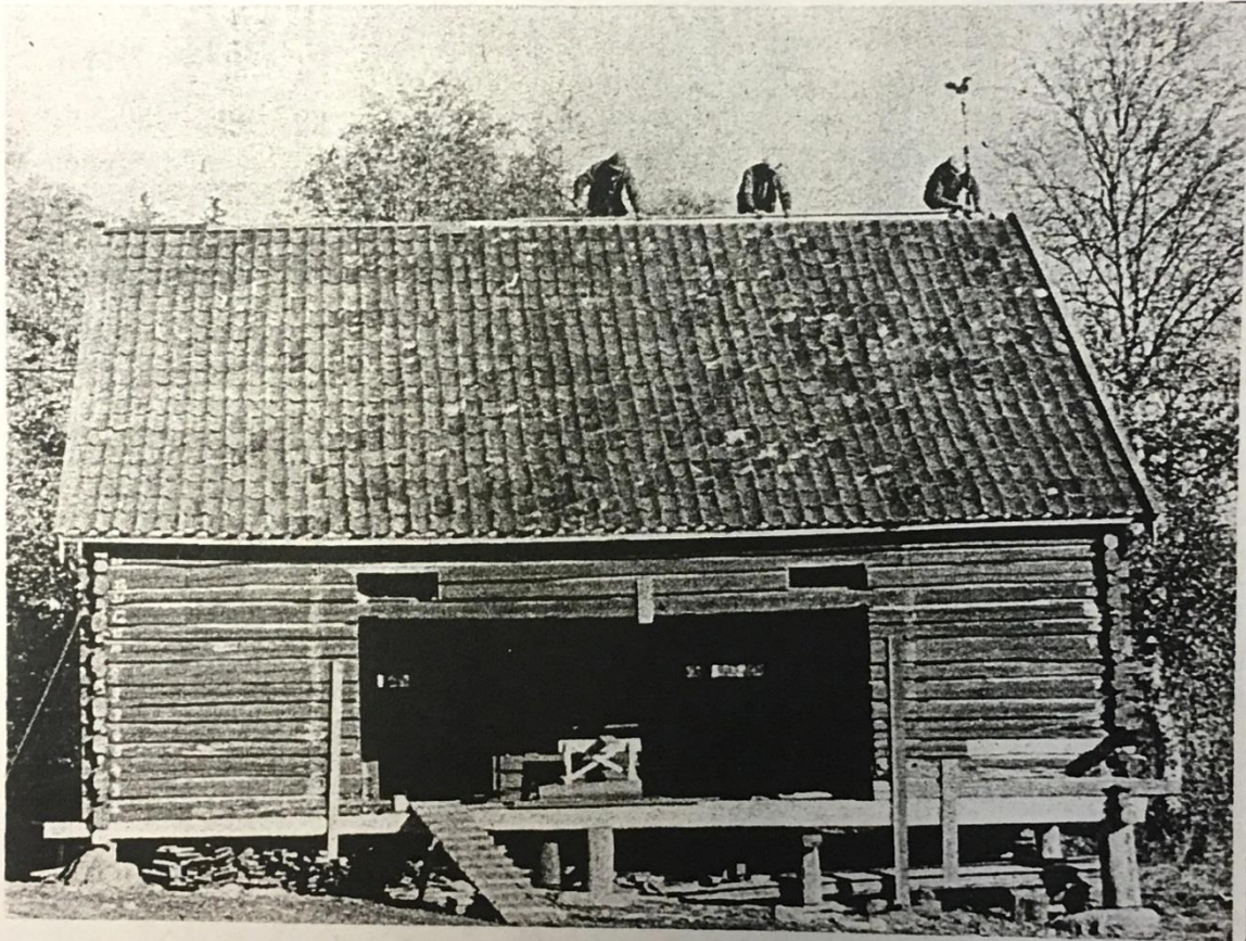
Dette gamle stabburet fra Nerby blir likesom «resepsjonen» på Eiktunet med blant annet kontor og rom for billettsalg. Som bildet forhåpentlig viser, har man vært nødt til å skifte inn litt nye materialer enkelte steder.

På Eiktunet er gjenreisningen av et gammelt stabbur fra Nerby gård i Vardal snart fullført. Stabburet, som stammer fra sent på 1600-tallet eller tidlig på 1700-tallet, sto opprinnelig på Berg gård, men ble senere flyttet til Nerby. Det er temmelig stort, 90 kvadratmeter grunnflate i to etasjer.