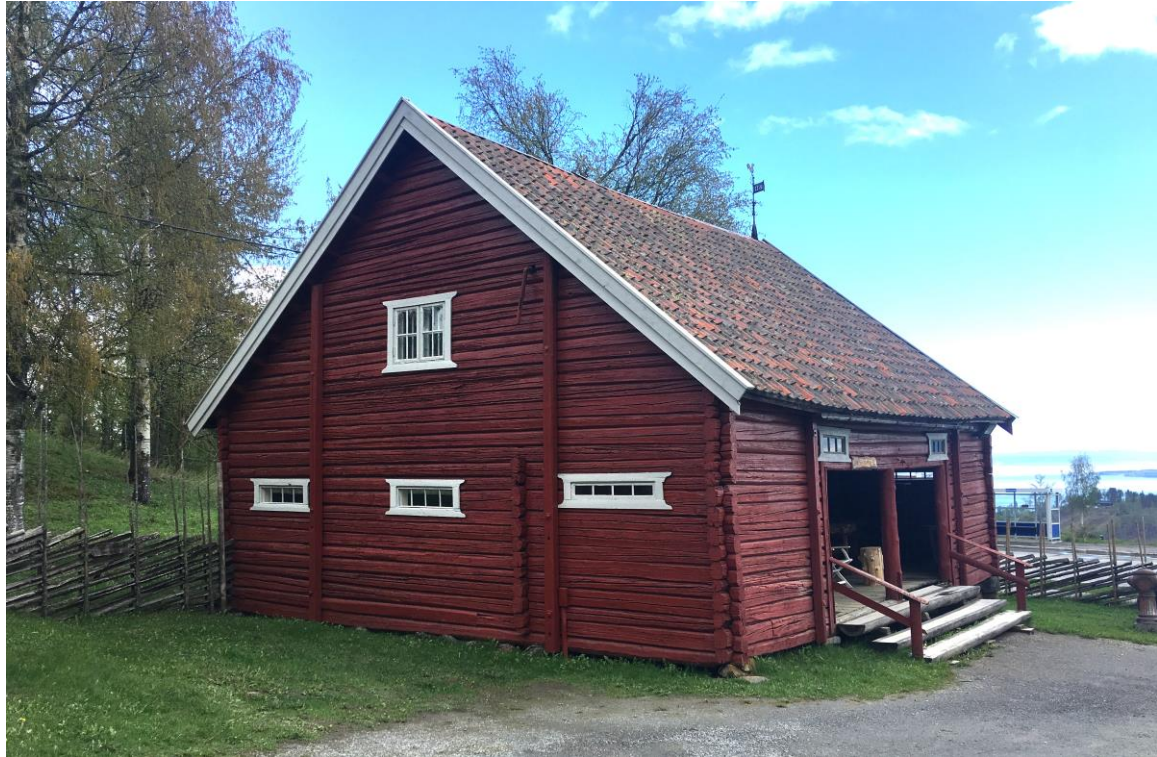
Stabburet fra Nerby blir bl. a. benyttet til snekkerverksted for Gjøvik Husflidlag.